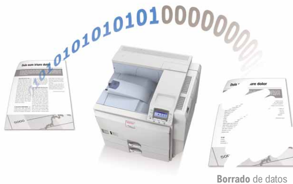
Borrado de datos